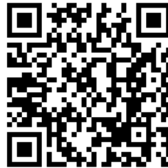
Karekod 2 Öğrenci no Sorgulama