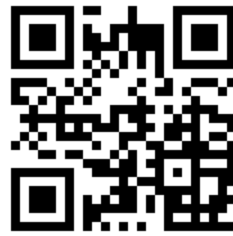
Karekod 4 Öğrenci İşleri Daire Başkanlığı Web Sayfası