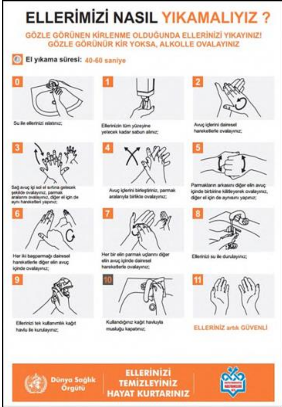
Şekil 1. Hijyenik el yıkama işlemi