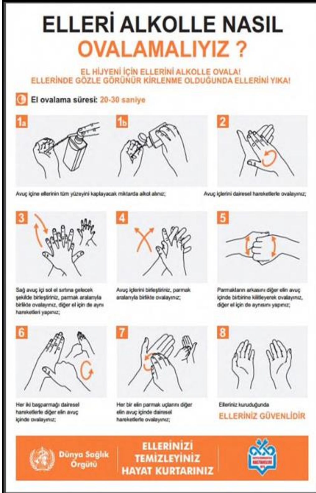
Şekil 2. Alkol bazlı el antiseptiği ile el ovalama işlemi: