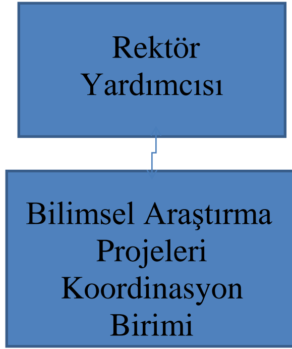
Şekil 3: Birimin Üniversite İçerisindeki Yeri

Rektör Yardımcısına bağlı olarak hizmet veren Bilimsel Araştırma Projeleri Koordinasyon Birimi, yeterli uzmanlığa sahip olan Akademik Personelin, Bilimsel ve Teknolojik alanda yaptığı araştırmalarla ilgili olarak proje destek hizmetlerini yürütmektedir. (Şekil-3)