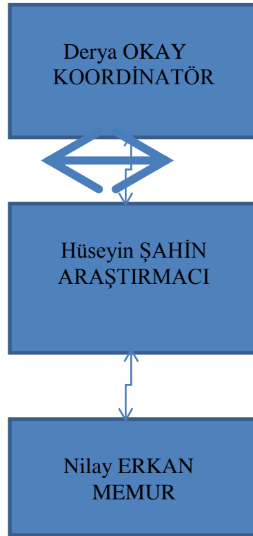
Şekil 1: Birim Stratejik Plan Hazırlama Komisyonu Üyeleri

Birimimizde personel sayısı sınırlı olduğundan mevcut dört personelin üçü ile Stratejik Planlama Komisyonu oluşturulmuştur. (Şekil 1)