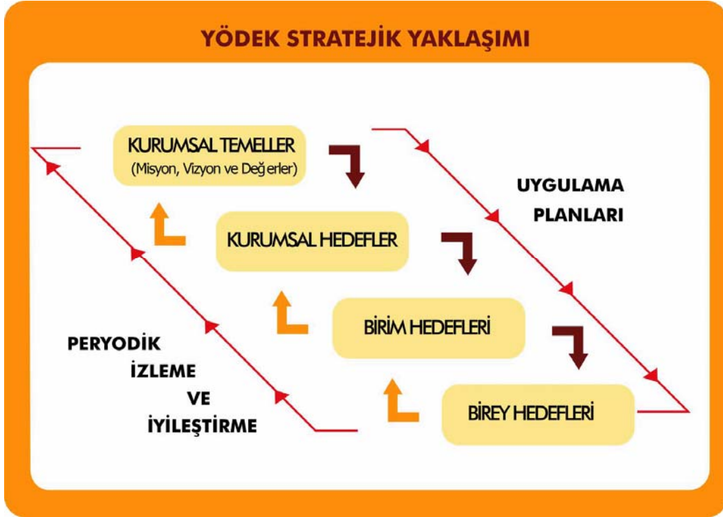
Şekil 2. Yükseköğretim Akademik Değerlendirme ve Kalite Geliştirme Çalışmaları Stratejik Yaklaşımı.

Belirlenen her strateji ve/veya amacın gerçekleştirilebilmesi için, ilgili kurum bünyesinde ölçülebilir ve net olarak anlaşılabilir nitelikte birim veya alt birim hedefleri oluşturulur. İlgili birim yöneticilerinin bu hedefleri gerçekleştirmeden sorumlu olması beklenir. Süreç yönetimi uygulayan yükseköğretim kurumlarında ise oluşturulan birim hedefleri ilgili süreçlerin hedeflerine dönüştürülerek, süreç sorumlularının bu hedefleri gerçekleştirilmesi beklenir.