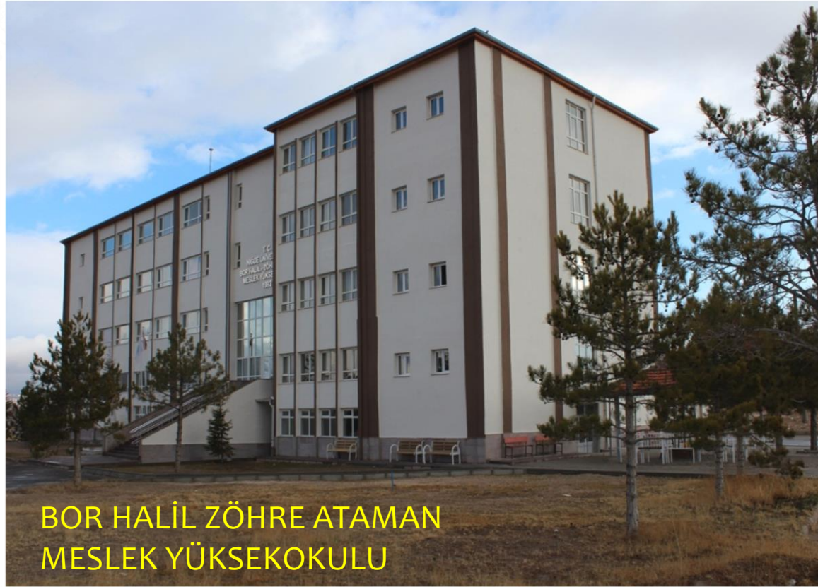
BOR HALİL ZÖHRE ATAMAN MESLEK YÜKSEKOKULU