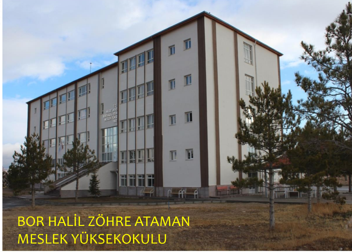
BOR HALİL ZÖHRE ATAMAN MESLEK YÜKSEKOKULU