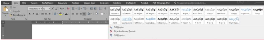
Şekil 1.2. Yazı stillerinin seçilmesi

Her türlü matematik, kimya formülleri, denklemleri ile ifadeler, açık ve temiz biçimde yazılmalıdır. Denklemlere, ilgili bölüm içinde sıra ile numara verilir. Bu numaralar [(1.1), (1.2), ....., (2.1), (2.2), ...] (gerekirse aynı denklemin alt ifadeleri (1.1a) , (1.1b) olarak şeklinde satırın en sağına yazılır.