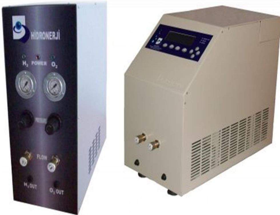
H-HOJ/300 SERİSİ HİDROJEN VE OKSİJEN ÜRETEN PEM ELEKTROLİZÖRLER