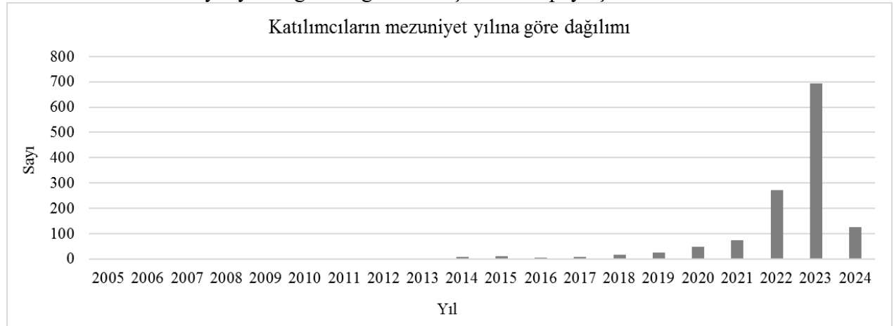
Şekil 1. Katılımcıların mezuniyet yılına göre dağılımı

Katılımcıların mezuniyet yılına göre dağılımı ise Şekil 1'de paylaşılmaktadır.