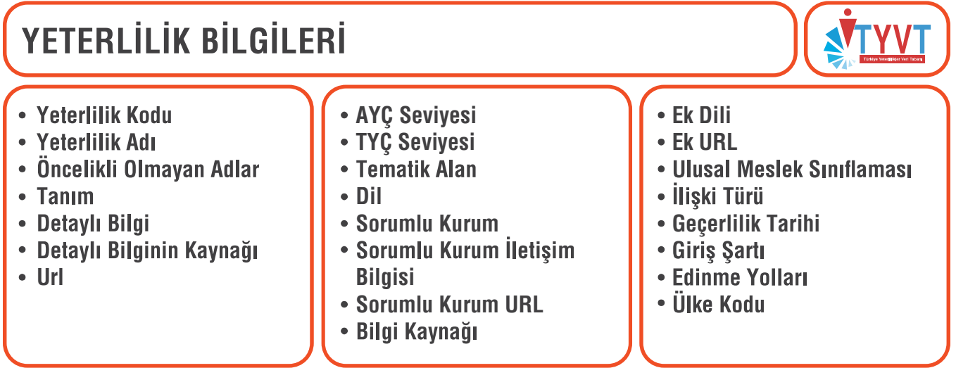
Şekil 3: TYVT'ye Eklenen Yeterlilik Bilgileri