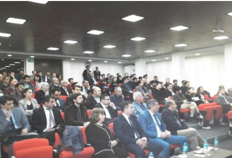
KÜSİP Bilgilendirme Semineri (29.03.2018)

KÜSİ Üyeleri olarak Kırıkkale'de düzenlenen TR71 Bölgesi KOSGEB-KOBİGEL (Kobi Gelişim Destek Programı) Çalıştayı'na katılım sağlandı.