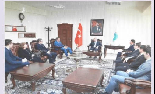
NÖHÜ Rektör Ziyareti (29.03.2018)

BSTB Bilim ve Teknoloji Genel Müdürlüğü yetkilileri/uzmanları ile birlikte NİĞMER Tasarım Merkezi'nde incelemeler yapıldı.