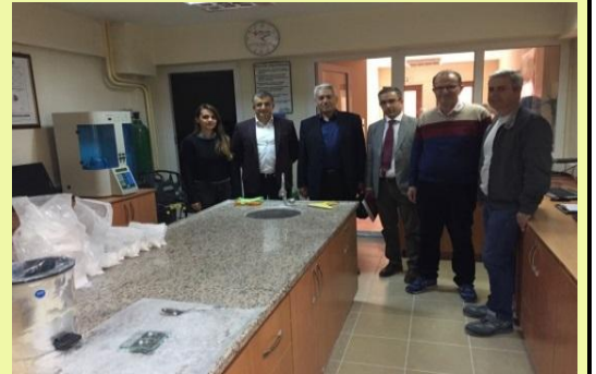
Mikron'S - Firma Ziyareti (22.03.2018)

Bor Karma OSB'de faaliyet gösteren Ertan Makina Ltd. Şti. ziyaret edilerek KÜSİ ve KOSGEB destekleri anlatıldı. Üniversite ile proje işbirlikleri ve stajyer konuları görüşüldü.