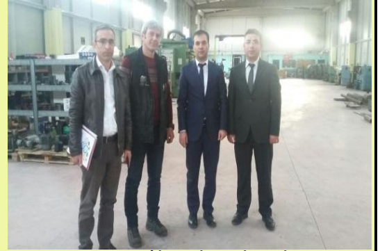
Ertan Makina - Firma Ziyareti (21.03.2018)

Bor Karma OSB'de faaliyet gösteren ve yemlik çinko oksit üreten ZNO Kimya Metal Ltd.Şti. ziyaret edildi, KÜSİ bilgilendirmesi yapıldı, Üniversitenin test/analiz imkanları ile KOSGEB destekleri anlatıldı.