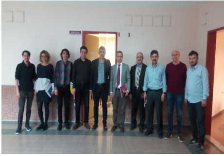
Akademisyen Bilgilendirme Ziyareti (22.03.2018)

Kaynak: Bilim, Sanayi ve Teknoloji Bakanlığı (2017)