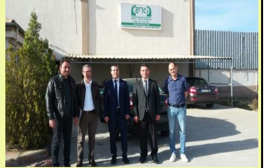
ZNO Kimya - Firma Ziyareti (21.03.2018)

NÖHÜ Maden Mühendisliği Bölümü öğretim üyelerine KÜSİ faaliyetleri konusunda bilgilendirme yapıldı. Niğde'deki madencilik sektörünün sağladığı işbirliği fırsatları anlatıldı.