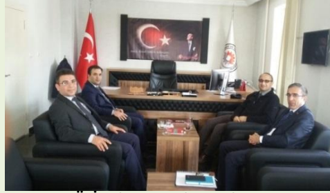
KÜSİ Çalışma Grubu Toplantısı (03.03.2018)

KÜSİ Çalışma Grubu üyeleri ilk toplantısını Bilim, Sanayi ve Teknoloji İl Müdürlüğü'nde yaptı. Toplantıda; Bilim, Sanayi ve Teknoloji Bakanlığı'nın Niğde İli için 2018 yılında yapılmasını öngördüğü 11 faaliyet alanı ele alındı.