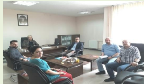
Akademisyen Bilgilendirme Ziyareti (19.03.2018)

Niğde Teknopark'ta yapılan toplantıda sanayi projesi yürütmüş akademisyenlere Teknopark'ta firma kurmaları konusunda bilgilendirme yapıldı.