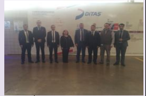
DİTAŞ - Ar-Ge Merkezi Ziyareti (29.03.2018)

BSTB Bilim ve Teknoloji Genel Müdürlüğü yetkilileri/uzmanları Niğde OSB Toplantı Salonunda KÜSİ, KÜSİP Portalı, 4.Sanayi Devrimi ve Teknopark sunumları gerçekleştirdi.