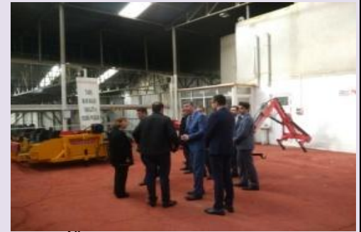
NİĞMER - Tasarım Merkezi Ziyareti (29.03.2018)

BSTB Bilim ve Teknoloji Genel Müdürlüğü yetkilileri/uzmanları ile birlikte DİTAŞ Ar-Ge Merkezi ziyaret edildi.