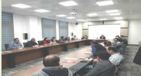
TGB-Akademisyen Bilgilendirme Toplantısı (12.03.2018)

KÜSİ Çalışma Grubu üyeleri ilk toplantısını Bilim, Sanayi ve Teknoloji İl Müdürlüğü'nde yaptı. Toplantıda; Bilim, Sanayi ve Teknoloji Bakanlığı'nın Niğde İli için 2018 yılında yapılmasını öngördüğü 11 faaliyet alanı ele alındı.