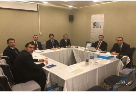
KOBİGEL Çalıştayı (27.03.2018)

NÖHÜ İnşaat Mühendisliği Bölümü öğretim üyelerine KÜSİ faaliyetleri konusunda bilgilendirme yapıldı.