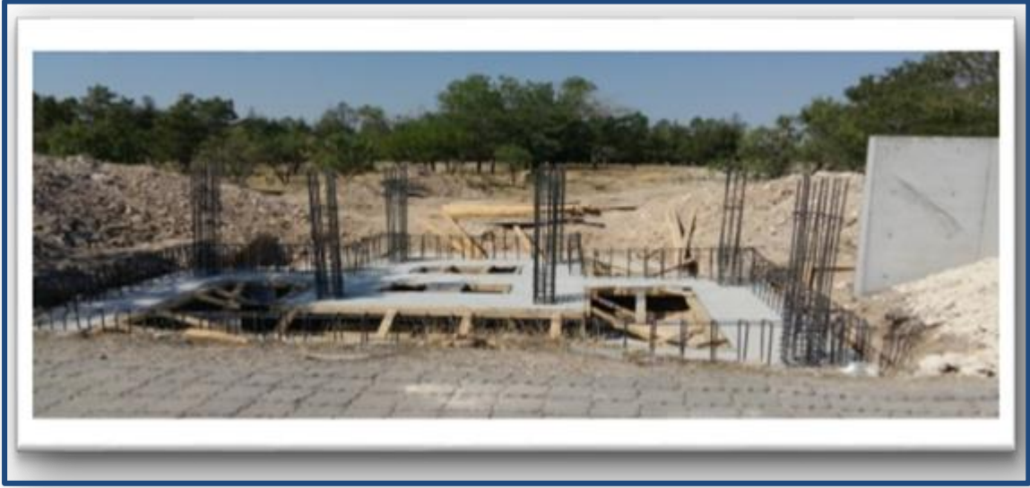
Altyapı 5.kısım işleri

7161 sayılı Kanun ve 4735 sayılı Kamu İhale Sözleşmeleri Kanununa eklenen Geçici 4 üncü madde gereğince yüklenici idaremize işin tasfiyesi talebinde bulunmuştur. Hazine ve Maliye Bakanlığının uygun görüşü ile tasfiye çalışmaları tamamlanarak hesap kesme hakedişi yapılmıştır.