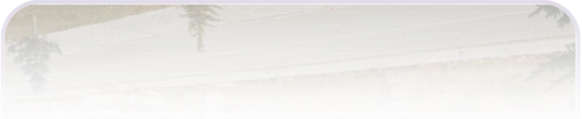
Konservatuvar binası inşaatı