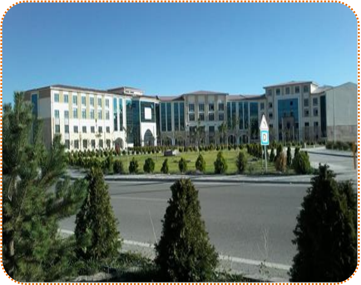
Tıp Fakültesi Morfoloji Derslik Binası inşaatı

2020 yılı ödeneği 1.000.000.TL olup ödeneğin 505.911,09.TL.'si harcanmış, 494.088,91.TL.'si harcanamamıştır. Binamızın geçici kabulü yapılarak kesin kabul aşamasına gelinmiştir.