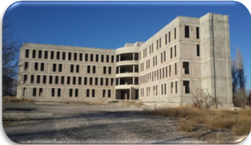
Konservatuvar binası inşaatı

2019 yılı ödeneği 4.400.000.TL olup, ödeneğin 86.724,42 TL'si harcanmış olup 1.650.000,00 TL'si Morfoloji Binasına aktarılmıştır. A-B-D blokların betonarme karkas imalatları ve kaba inşaat çalışmaları tamamlanmıştır. C-E blok zemin ve 1. kat betonarme karkas imalatları seviyesindedir. 7161 sayılı Kanun ile 4735 sayılı Kamu İhale Sözleşmeleri Kanununa eklenen geçici 4 üncü madde gereğince yüklenici idaremize işin tasfiyesi talebinde bulunmuş ancak Hazine ve Maliye Bakanlığınca tasfiyesi uygun görülmemiştir. Yüklenici sözleşme hükümlerine uymadığından 23.09.2019 tarih ve E.23647 sayılı olur ile sözleşmesi feshedilmiştir. Fiziki gerçekleşme % 30 olarak gerçekleşmiştir.