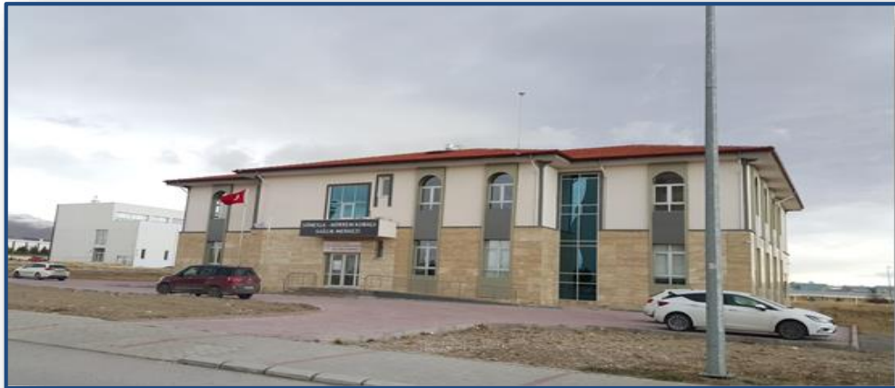
Süheyla-Hürrem Kubalı Aile Sağlık Merkezi