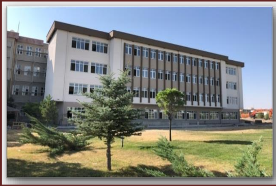
IİBF ek derslik inşaatı