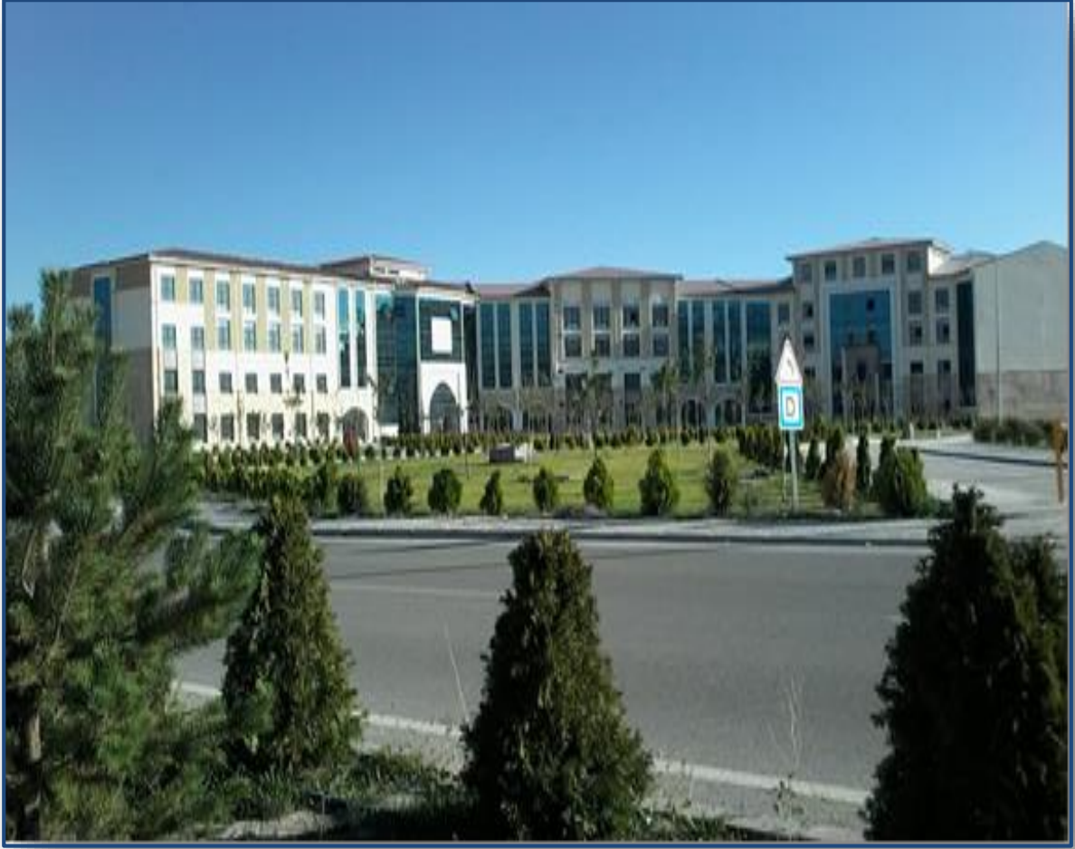
Tıp Fakültesi Morfoloji Derslik Binası inşaatı