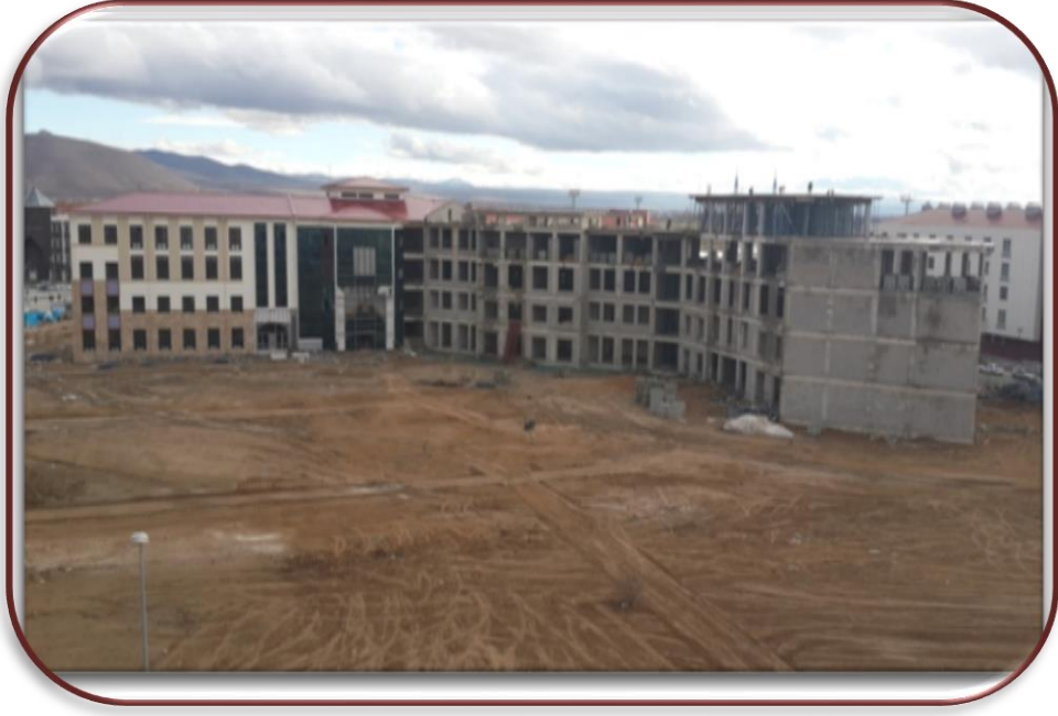
Tıp Fakültesi inşaatı