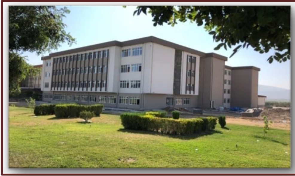
İİBF ek derslik inşaatı

2018 yılı ödeneği 3.000.000.TL olup, 7066 sayılı Merkezi Yönetim Bütçe Kanununun 6/5 maddesi uyarınca 11.238.000.TL likit karşılığı ödenek kaydı, 5/3 maddesi uyarınca 2.000.000.TL yatırımları hızlandırma ödeneğinden eklenmesiyle yılsonu ödenek toplamı 16.238.000.TL olarak gerçekleşmiştir. Ödeneğin 16.015.448.TL'si harcanmış olup, 222.552.TL ödenek harcanmamıştır. Betonarme karkas ve kaba inşaat çalışmaları tamamlanmış olup, ince imalatlar devam etmektedir. Bina tamamlanma aşamasında olup, sonlandırma imalatları devam etmektedir. Geçici Kabul çalışmaları başlamıştır. Fiziki gerçekleşme % 99 olarak gerçekleşmiştir.