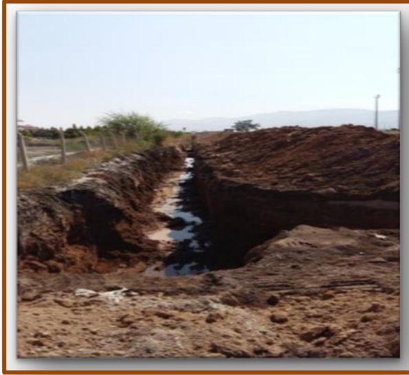
Altyapı 5.kısım işleri

Merkez Yerleşkede İletişim Fakültesi yapı peyzaj imalatları devam etmektedir. Bor Yerleşkesi araç yolu ve peyzaj imalatları devam etmektedir. BESYO yerleşkesinde yol kazısı (tesviye vb.) başlamıştır. Yağmur suyu imalatları % 80 tamamlanmış olup, fiziki gerçekleşmesi % 20'dir.