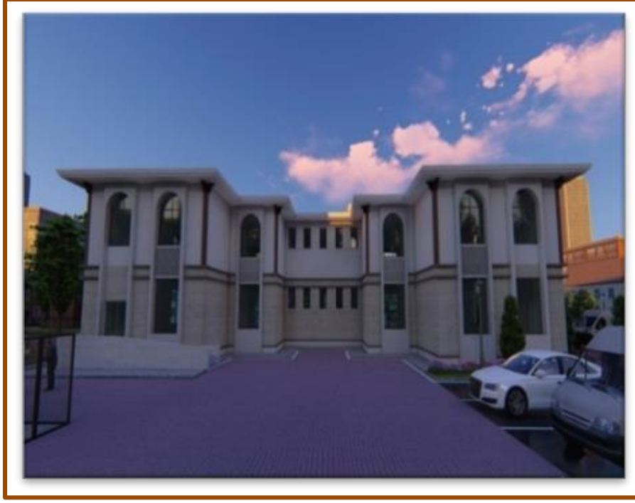
Süheyla-Hürrem Kubalı Aile Sağlık Merkezi inşaatı