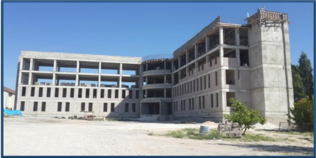
Konservatuvar binası inşaatı

2018 yılı ödeneği 5.750.000.TL olup, ödeneğin 1.835.701.TL'si harcanmıştır. 2018 yılı içerisinde A-B-D blokları betonarme karkas imalatları tamamlanmış, kaba inşaat çalışmaları devam etmektedir. C-E blok su basman seviyesinde olup betonarme karkas imalatları devam etmektedir. Fiziki gerçekleşme % 30 olarak gerçekleşmiştir.