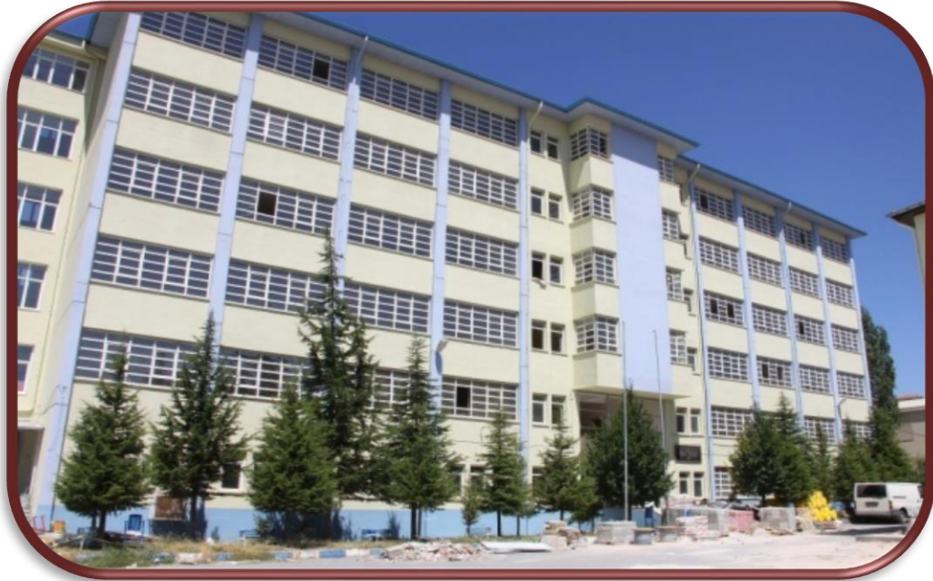
Eski Eğitim Fakültesi Binasının Tadilat ve Onarımı