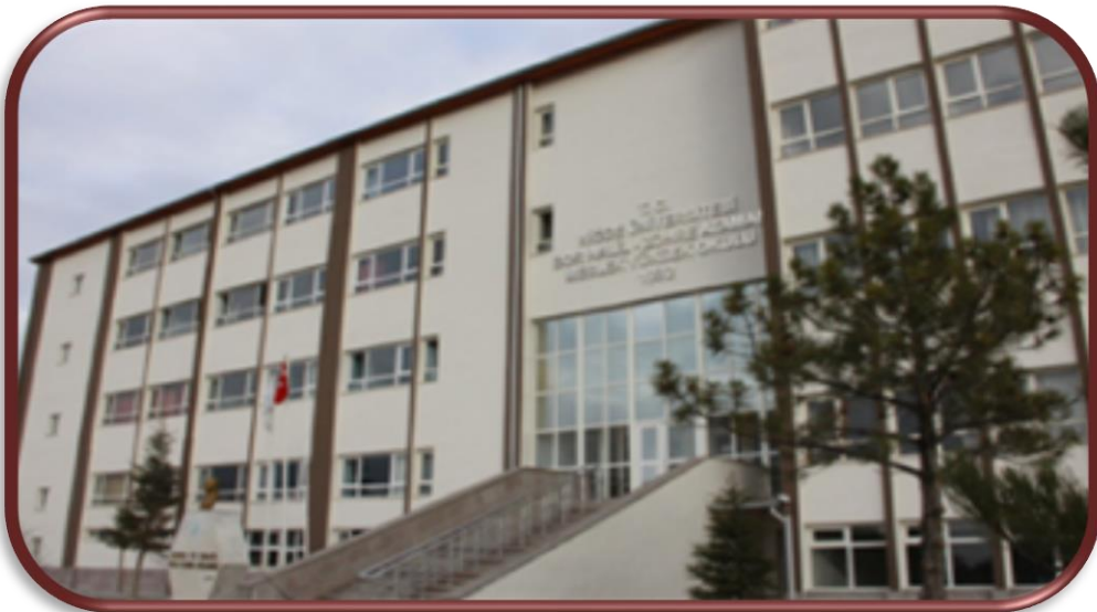
Halil-Zöhre Ataman Meslek Yüksekokulu Binası Tadilatı