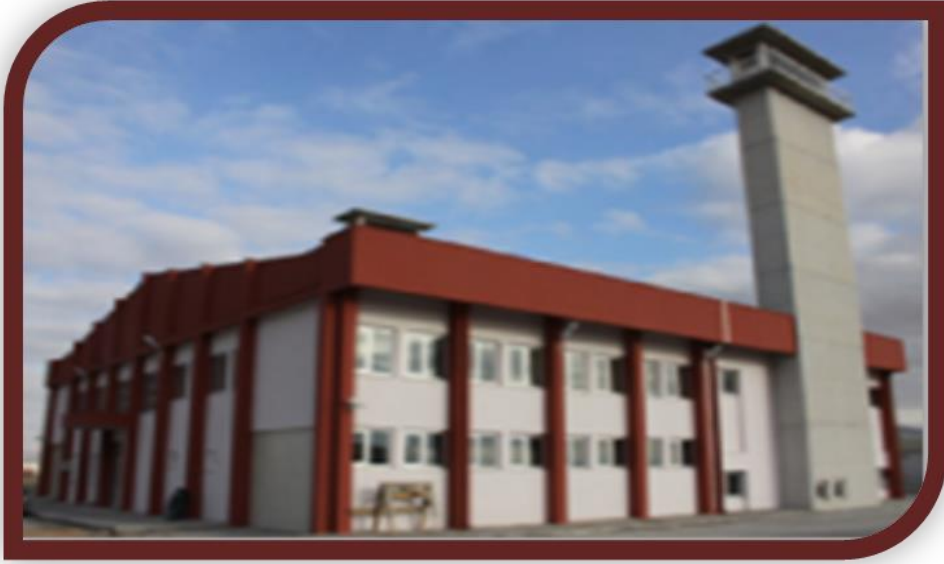
Isı Merkezinin Garaja Dönüştürülmesi