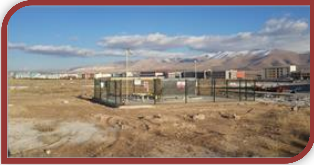
Doğalgaz RMS-B İstasyonunun Kapasitesinin Artırılması