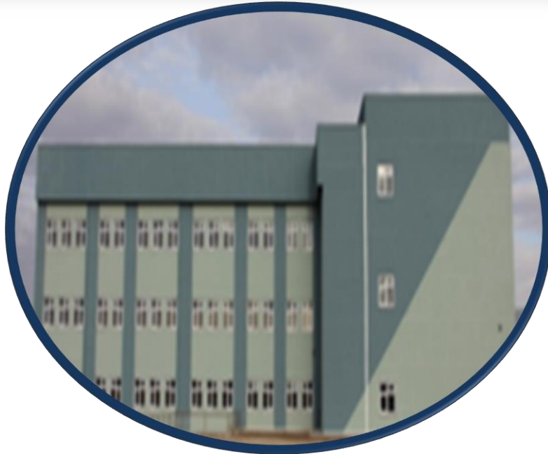
Mühendislik Fakültesi Ek Derslik İnşaatı