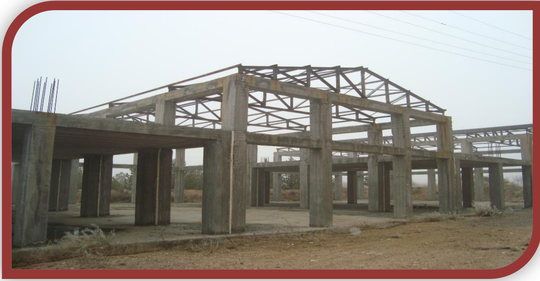
Halil-Zöhre Ataman Meslek Yüksekokulu Atölye Binasının Tadilatı