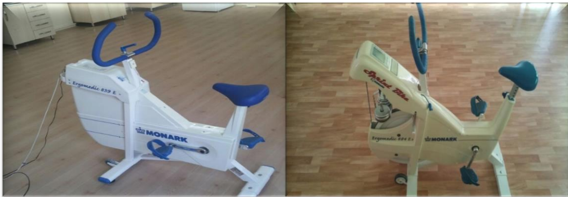
Resim-5. Monark Bisiklet Ergometreleri