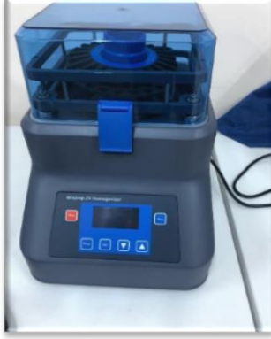
Resim-18. Homogenizer Cihazı (Tıp Fakültesi Laboratuvarı)