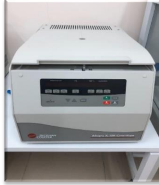
Resim-19. Santrifüj Cihazı (Tıp Fakültesi Laboratuvarı)