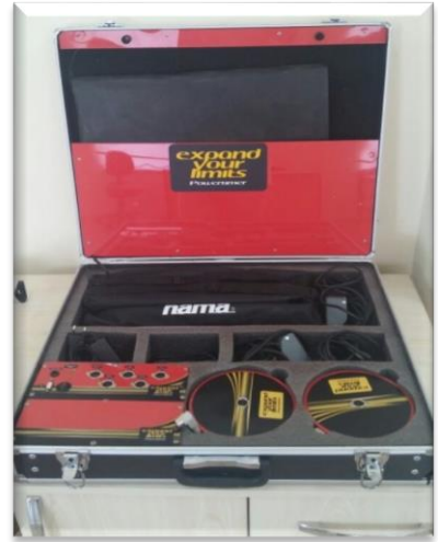
Resim-4. New Test Power Timer