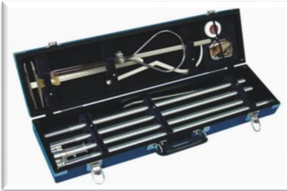
Resim-14. Antropometrik Ölçüm Seti