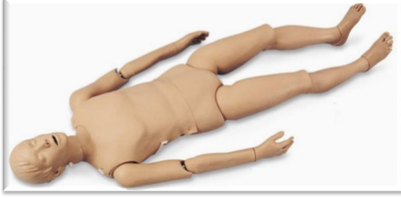
Resim-17. İlk yardım eğitim seti