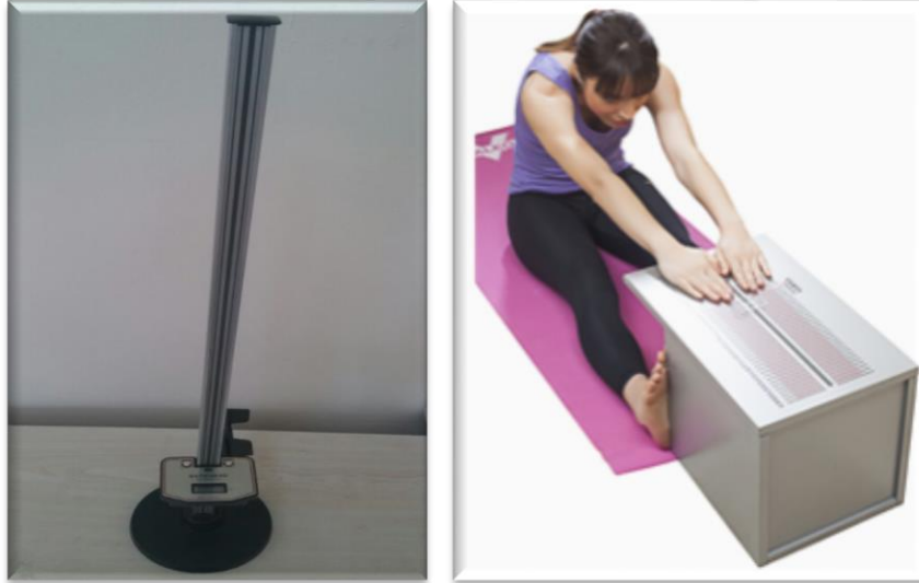
Resim-10. Esneklik Ölçüm Aparatları