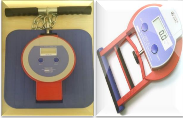
Resim-3. Sırt-Bacak- El Kavrama Dinamometreleri