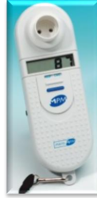
Resim-2. Akciğer Fonksiyon Test Cihazları