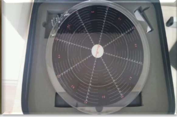
Resim-7. Denge Ölçüm Cihazı