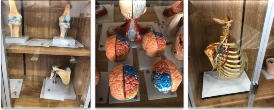
Resim-15. Organ ve doku modelleri