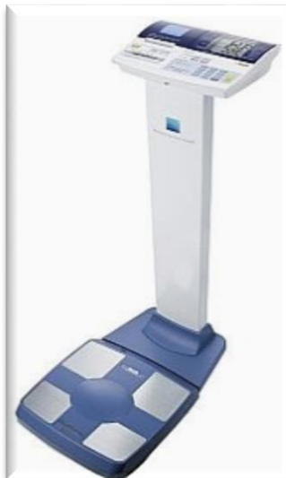
Resim-11. Vücut Kompozisyonu analizörü