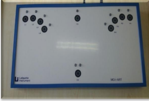
Resim-6. Lafayette Reaksiyon Test Ölçüm Sistemi