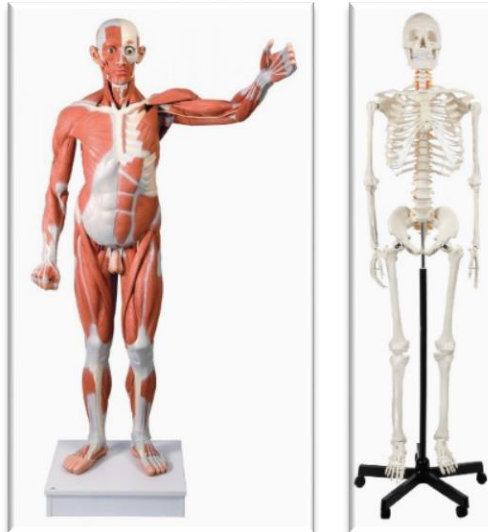
Resim-16. Kas-İskelet Modelleri