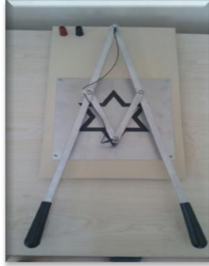
Resim-8. Yıldız Testi