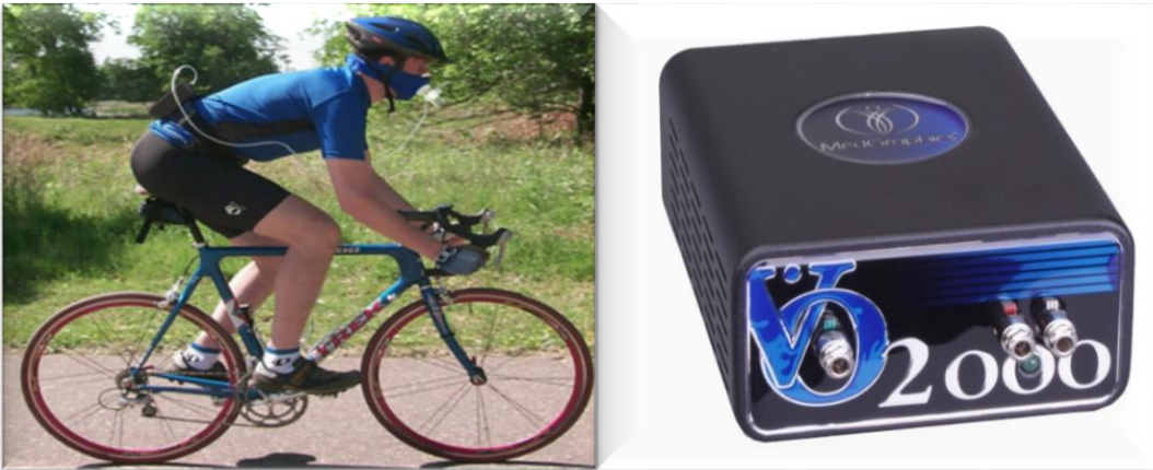
Resim-1. Gaz Analizörü