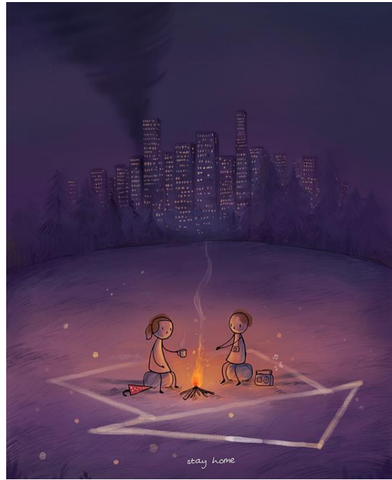
Görsel 1. Vimal Chandran, İllüstrasyon Çalışması.

İllüstrasyon sanatçıları, “#evdekal/#stayhome” etiketinden yola çıkarak farklı konuları ele almışlar ve bu konuları farklı gösterge türleriyle açıklamışlardır.