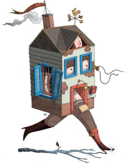
Görsel 6. Sadi Tekin, İllüstrasyon Çalışması.

Ekşioğlu'nun çalışmasında ev gerçek şeklinde tasvir edilmiştir. Evin çatı yerinden bir sürü çiçek doğaya açılıyor. Böyle yaparak doğanın yenilendiği ve kirli havanın azaldığı anlatılmak istenmiştir. Evin arkasında açık bir gökyüzü ve deniz yer almaktadır. Havada uçan bir kuş, deniz üzerinde de bir gemi çizilmiştir. Evlerimizde kalarak sadece kendimizi ve başkalarını korumakla kalmıyoruz, ayrıca doğayı da korumuş oluyoruz.